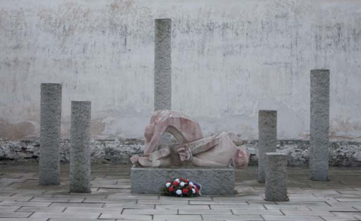
Věžeňský dvůr v Třešti