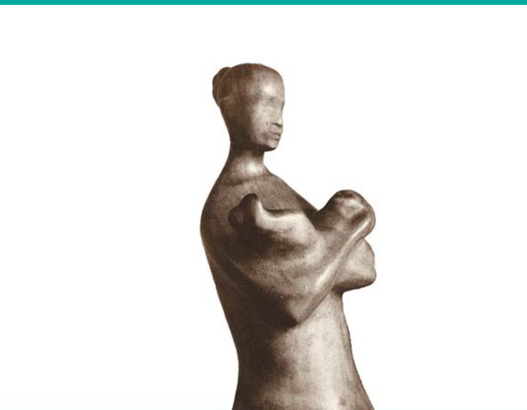
Matka s dítětem, 1963

V roce 2011 vydal Muzejní spolek v Třešti za finanční podpory Města Třešť. Vydáno u příležitosti výstavy o Jaroslavu Krechlerovi v Muzeu Vysočiny Jihlava, pobočka Třešť.