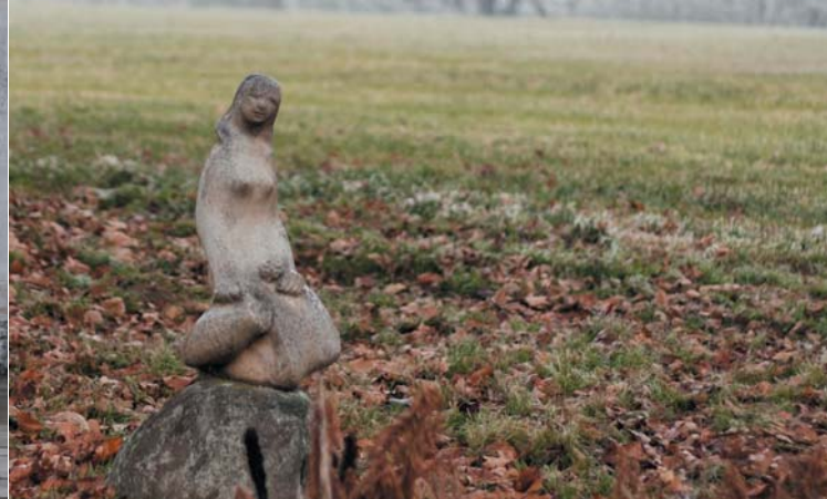
Jarní studánka (pramen řeky Dyje)