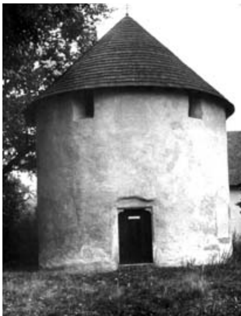
obrazová příloha č. 1.

Působení regionálních vlastivědných pracovníků na Stonařovsku nevymizelo ani po desetiletích. Dokladem jejich úsilí jsou novinové články a dvě restaurované památky. Jejich odkaz žije ve formě historického povědomí obyvatel Stonařovska.