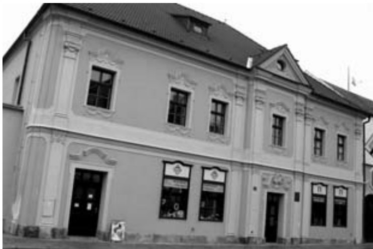
v roce 2004 se muzeum stěhuje do zrekonstruovaného Schumpeterova domu

Zpracovala Milina Matulová dle materiálů Státního okresního archivu v Jihlavě