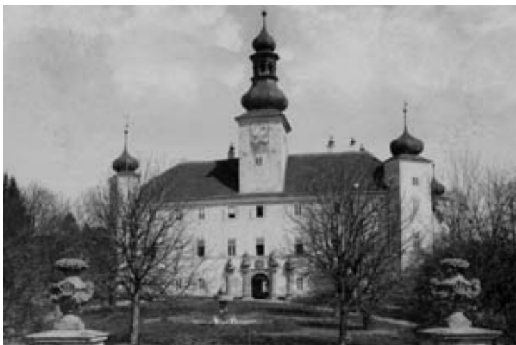
pohlednice zámku v Třeštni - okolo roku 1910