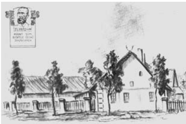
pohlednice ze znovuožhalení 9. září 1945 (deska byla ve válečných letech 1939 - 1945 odstraněna)