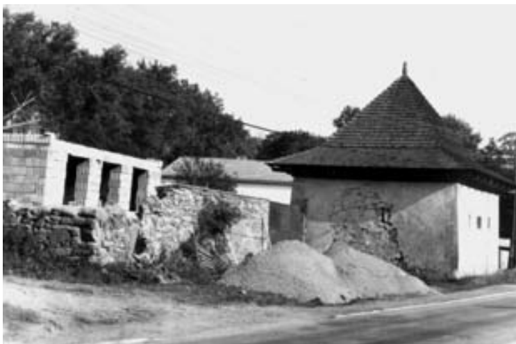
obrazová příloha č.2. Prostředkovice, sýpka u domu č.p. 13. Stav v roce 1997. Nejstarší doklad sel- ské stavby z doby předbělohorské a příznivé hospodářské situace v zemědělství na Stonařovsku. Památka, pro kterou se nenašlo odpovídající využití.