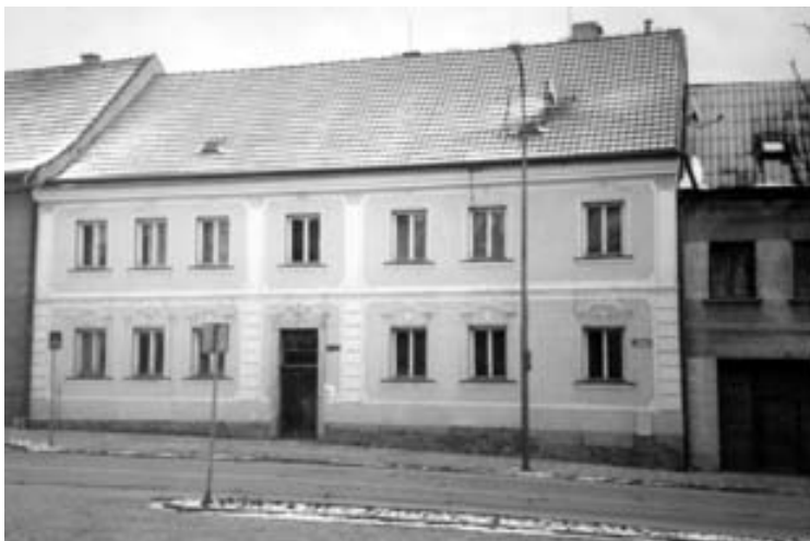
první budova muzea, dům na náměstí č. 18

vedl soustavně. Konzervovalo se jen v nejnútnejších případech, kvalita instalace byla neuspokojivá a překonaná a co je nejdůležitější, již znovu se začalo hovořit o nevyhovujícím umístění sbírek a zařízení. A za vším byly tradičně finanční důvody. Částka 100,- korun, kterou činnost muzea každoročně podporovala Cyrilometodějská záložna, členské příspěvky a další dary dobrodinců pro bezpečné uložení sbírek a zpřístupnění pro veřejnost v uspokojivé kvalitě, navíc v těžkých letech války, nestačily. I zájem návštěvníků klesá - z rekordních 600 lidí v r. 1935 na 150 v r. 1939.