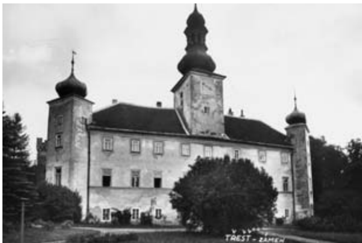
zámeček Třešť - sídlo muzea v letech 1951 až 1983

Od něj muzeum získává 7 místností na zámku a finanční částku (10 000,- korun) na pořízení inventáře - 16 modřínových vitrín, 1 zasklené a 3 stolových vitrín zhotovených ze starých beden. V r. 1949 muzejní sbírky ještě nebyly pro veřejnost zpřístupněny. V místnostech na zámku byl kromě předmětů z muzea i zámecký inventář (přesněji část, která zůstala v Třešti). Ten patřil v té době Fondu národní obnovy. Součástí muzejních sbírek se stala i stará část městského archivu. Většina těchto písemností se později dostala do archivu v Jihlavě a do rukou soukromých sběratelů. Osud muzejních sbírek by byl také vděč-