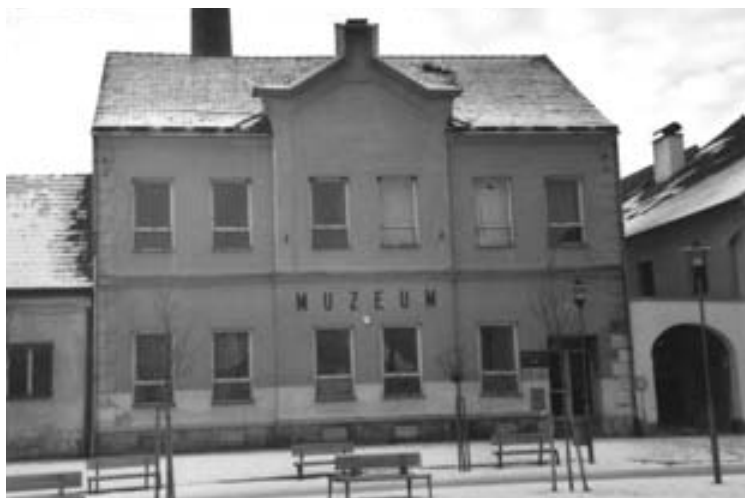
tzv. Marianum na Náměstí T.G. Masaryka čp. 103

Vzniklé městské muzeum na zámku bylo znovu otevřeno pro veřejnost v r. 1950 jako pobočka muzea v Telči. Správcem sbírek se po F. Liškovi stal v r. 1959 J. Kovářík a jako stálá expozice se o rok později prezentovala i obrazová galerie. Havarijní stav zámeckého objektu začíná situaci kolem muzea znovu výrazně komplikovat, což vedlo nakonec k jeho uzavření pro veřejnost v r. 1970. Pobočkou jihlavského muzea je třeštské muzeum od r. 1971. Nedostatečně zabezpečený zámecký