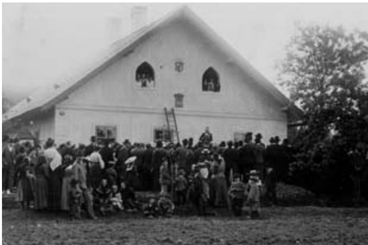
pohlednice z odhalení desky 11. září 1904