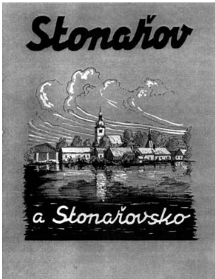
obrazová příloha č. 3.

Titulní strana nevydaného sborníku o dějinách Stonařovska.