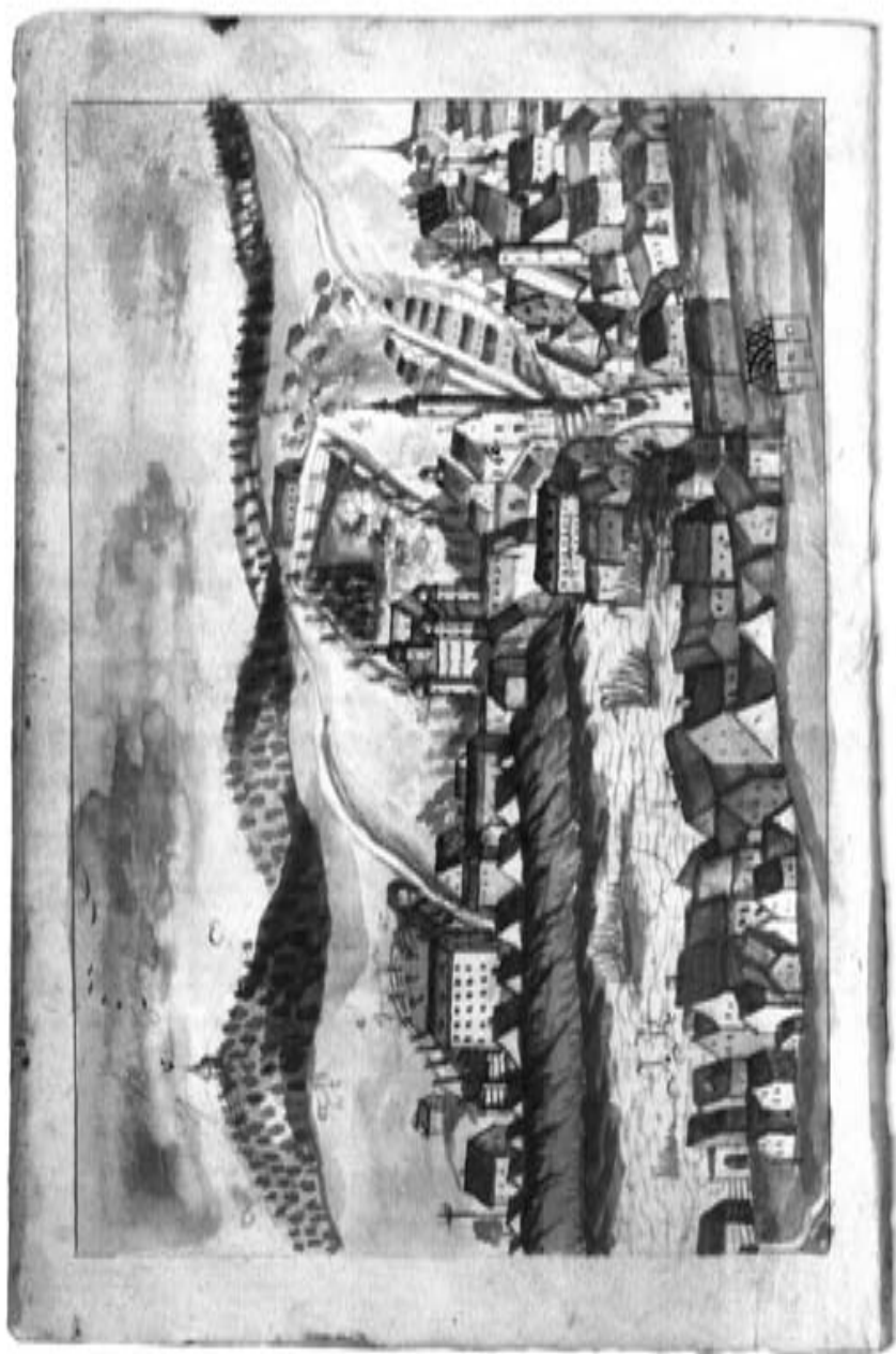
malba Třešť z Jabůrkovy kroniky